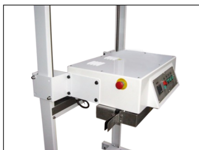
Version déport de tête