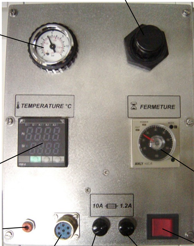
Contrôleur T° PID digital